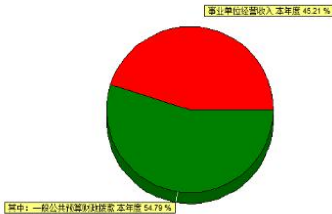
2020年收入占比分布图

曲靖市质量技术监督综合检测中心部门2020年度收入合计2,702.39万元。其中：财政拨款收入1,480.74万元，占总收入的54.79%；上级补助收入0.00万元，占总收入的0.00%；事业收入0.00万元，占总收入的0.00%；经营收入1,221.65万元，占总收入的45.21%；附属单位缴款收入0.00万元，占总收入的0.00%；其他收入0.00万元，占总收入的0.00%。与上年对比减少143.35万元，主要原因是：受疫情影响，经营收入减少。